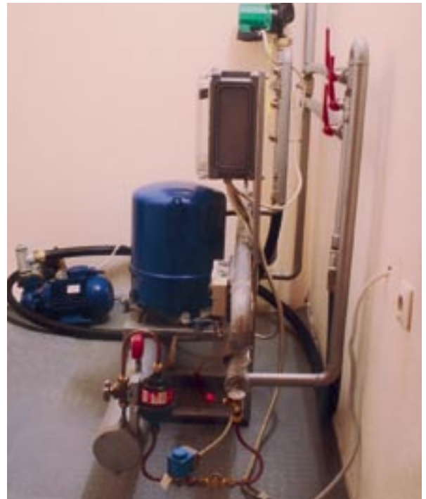
Toplotna pumpa snage 19 kW u firmi Bit inženjering (s boka)

Toplotna energija može da se uzme iz podzemnih voda koje su na temperaturi od oko 14°C tokom cele godine. Iz izbušenog bunara voda se