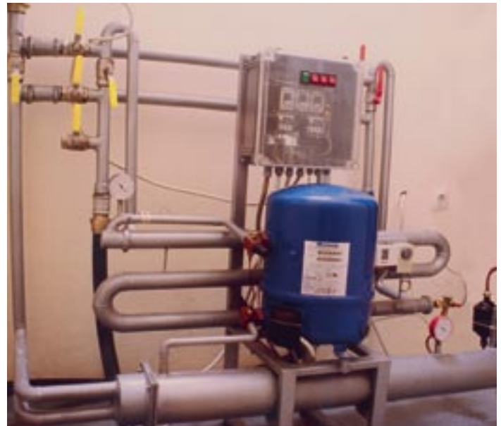
Toplotna pumpa snage 19 kW u firmi Bit inženjering (s preda)